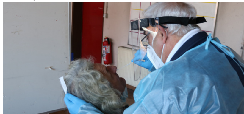
Erziehende, Lehrende sowie Betreuerinnen und Betreuer haben nun die Möglichkeit, beim DRK Bretten Antigen-Schnelltests durchführen zu lassen.

Neben Apotheken und Ärzten bietet die Stadt Bretten in Zusammenarbeit mit dem DRK in Bretten seit dem 2. März 2021 für Schulen und Kindergärten die Möglichkeit, Antigen-Schnelltests durchzuführen. Hierfür wurde ein zentrale Teststation beim DRK Bereitschaftsdienst Bretten, Breitenbachweg 3, eingerichtet. Die Erzieherinnen und Erzieher, Lehrende sowie Betreuerinnen und Betreuer als berechnete Personengruppe können täglich von Montag bis Freitag 6:30 bis 8:00 Uhr und 16:00 bis 18:00 Uhr getestet werden. Die berechnete Personengruppe erhält diesbezüglich im Vorfeld von Ihrem Arbeitgeber einen Link zur Anmeldung.