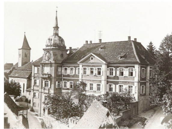
Diese von Dr. Pfister 1927 angefertigte Fotografie des Brettener Amtsgerichts fand nach 26 Jahren Ausleihzeit zum Stadtarchiv zurück.

Im vergangenen Jahr hatte das Stadtarchiv Bretten insgesamt 259 Benutzertage zu verzeichnen und damit einen neuen Rekord aufgestellt und dass, obwohl es pandemiebedingt 38,1 Prozent weniger Besucher gab als im Vorjahr. Während die Besucherzahlen zurückgingen, stieg die Anzahl der schriftlich bearbeiteten Anfragen auf 181 Einzelfälle an, was einem Zuwachs von 79,2 Prozent (80 Anfragen mehr als im Vorjahr) entspricht und seit Beginn der statistischen Erhebungen der bislang höchste Wert ist. Mit 38 Beiträgen in der Reihe #throwbackthursday auf dem Instagram-Account „stadtbretten“ setzte das Stadtarchiv die beliebte Foto-Reihe in den sozialen Netzwerken erfolgreich fort. Die im vergangenen März im Rathaus-Foyer eröffnete Wanderausstellung „1250 Jahre Kraichgau“, für die das Stadtarchiv ein eigenes lokales Fenster über Bretzens erste Regionalzeitung „Der Kraichgaubote,“ zusammenge-