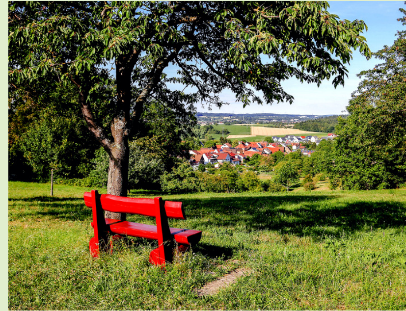
Eine kleine Pause mit Ausblick auf Dürrenbüchig

Tourist-Info Bretten Melanchthonstr. 3 75015 Bretten Tel.: 07252 58371-0 Email: tourist-info@bretten.de www.erlebe-bretten.de Öffnungszeiten: Mo-Do 9-18 Uhr und Fr 9-13 Uhr