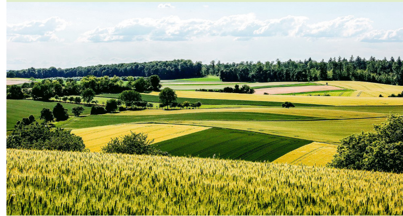
Die Natur vor der Haustüre genießen wie hier in Büchig.