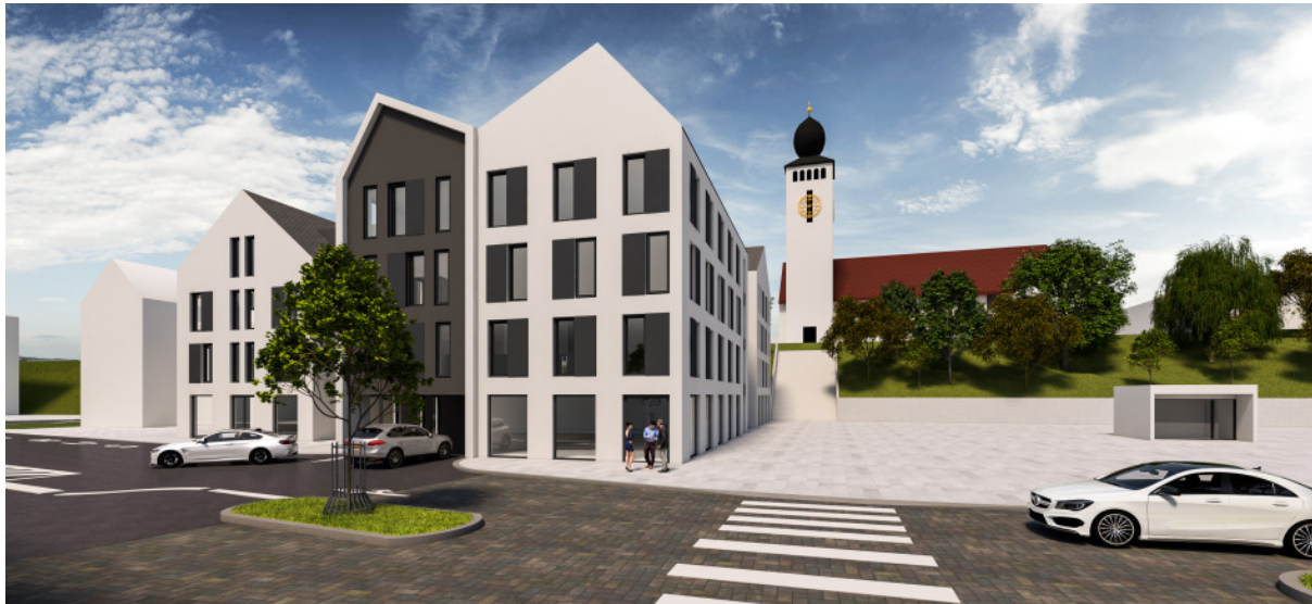
So soll das Dienstleistungszentrum mit Arztpraxen aussehen: Die Sichtachse von der Spitalgasse zum Kirchturm der Kirche St. Laurentius wird erhalten bleiben.