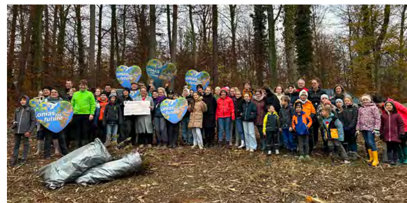
250 neue Bäume im Rinklinger Wald

nur über den Klimaschutz zu reden, sondern auch anzupacken. Forstamtsleiter Norbert Kuhn erläuterte ergänzend die Überlegungsprozesse der Forstverwaltung Bretten: Buchen machen derzeit rund 40 Prozent des Baumbestandes im Wald rund um Bretten aus, diese Baumart hat sich jedoch nicht als klimaresilient erwiesen, was an dem abfallenden Ästen überall zu sehen ist. Aufgrund der am Buchensterben ablesbaren veränderten Bedingungen sei es wichtig, auf klimaresiliente Baumarten bei Neupflanzungen zu setzen. So wurden Eichen als Lichtbaumart und Hainbuchen als dienende Baumart gepflanzt, damit sie die Eichenstämme beschatten und somit die natürliche Astreinigung unterstützen. (er)