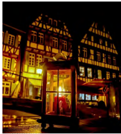
Stadt- und Themenführungen beleuchten die Vergangenheit der Kleinstadtperle Bretten.

Tourist-Info Bretten Melanchthonstr. 3, 75015 Bretten Tel.: 07252 583710 E-Mail: touristinfo@bretten.de Web: www.erlebe-bretten.de Online-Buchungen möglich unter: www.vhs-bretten.de (red)