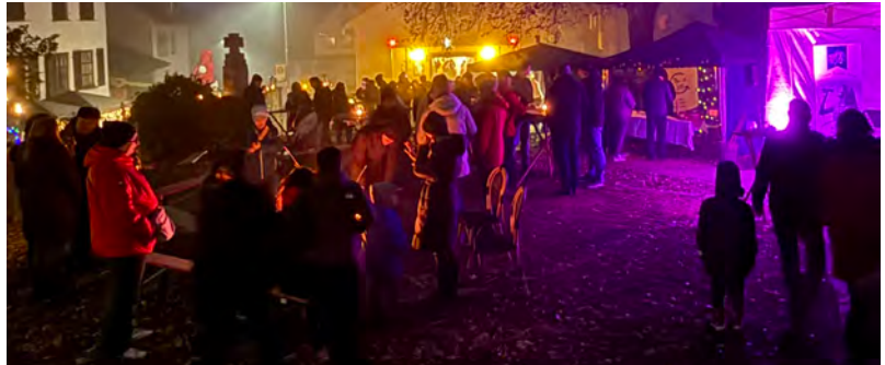
Viel zu sehen beim Weihnachtsmarkt Dürrenbüchig