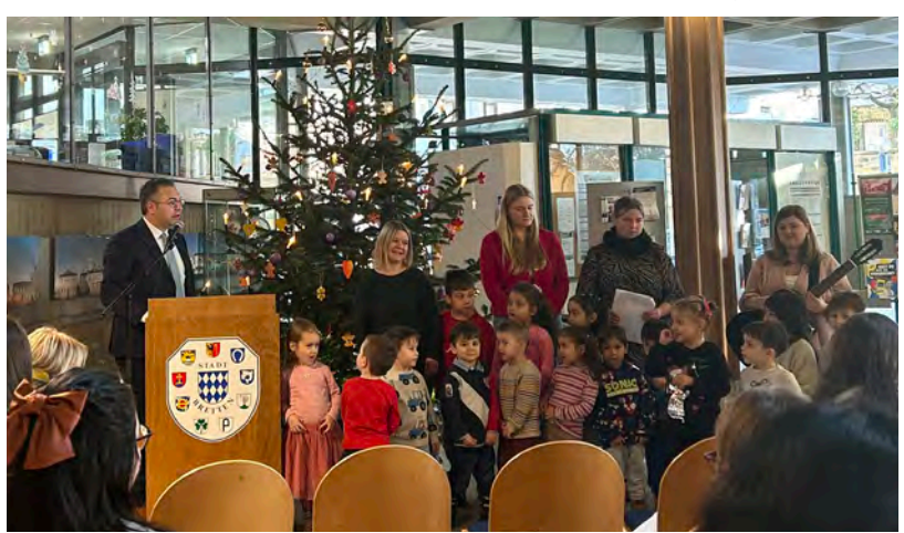
Eröffnung der Weihnachtsausstellung des Kindergartens Kraichgau-Hüpfer im Brettener Rathaus

Rathausbesucher erwartet eine bunte Überraschung: Die Weihnachtsausstellung des städtischen Kindergartens Kraichgau-Hüpfer präsentiert im Foyer Bastelideen zum Nachmachen für jede Jahreszeit. Die Schau „Eine kreative Reise durch das Kindergarten-Jahr“, die Oberbürgermeister Nico Morast am vergangenen Freitag gemeinsam mit Einrichtungsleiterin Anja Speck eröffnet hat, ist noch bis zum 7. Januar im Brettener Rathaus zu sehen. Getreu dem Ausstellungstitel unternahm OB Morast bei der Vernissage einen kurzen Streifzug durch die Geschichte des Kindergartens, der zunächst als „Kindergarten Sonnenblume“ in Gölshausen untergebracht war, ehe die Einrichtung im September des Jahres in die Hermann-Beutenmüller-Straße 10 zog. „Genug Platz für eine weitere Gruppe ist vorhanden“, äußerte der OB seine Wünsche für die Zukunft des Kindergartens, in der Kinder von einem Jahr bis zum Schuleintritt betreut werden. „Ein Schwerpunkt unserer Arbeit ist die Förderung der Kreativität