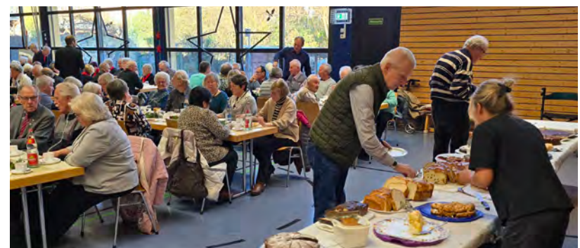
Leckerer Kuchen und Kaffee in guter Gesellschaft fanden großen Anklang bei den Gästen.