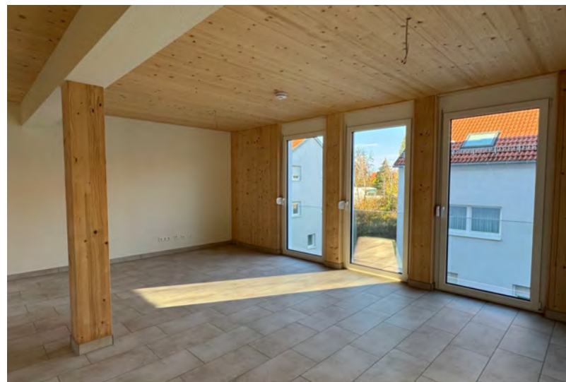
Innenaufnahme der Kleiststraße 6