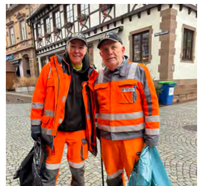
Im Einsatz

Die Mitarbeiterinnen und Mitarbeiter des städtischen Baubetriebs sind täglich im Einsatz, um für Sauberkeit und Ordnung zu sorgen. Sie halten die Straßen, Plätze und Gehwege frei von Abfällen und tragen so wesentlich zu einem gepflegten Stadtbild bei. Die Stadt Bretten schätzt ihren Einsatz sehr und bedankt sich bei allen Bauhofmitarbeitern für ihren Beitrag zu einer attraktiven und lebenswerten Stadt. (er)