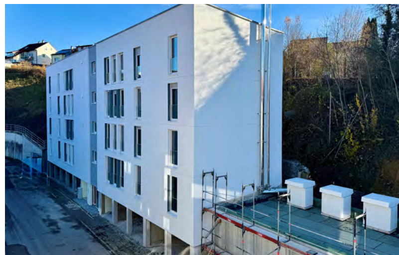
Außenaufnahme der Kleiststraße 6