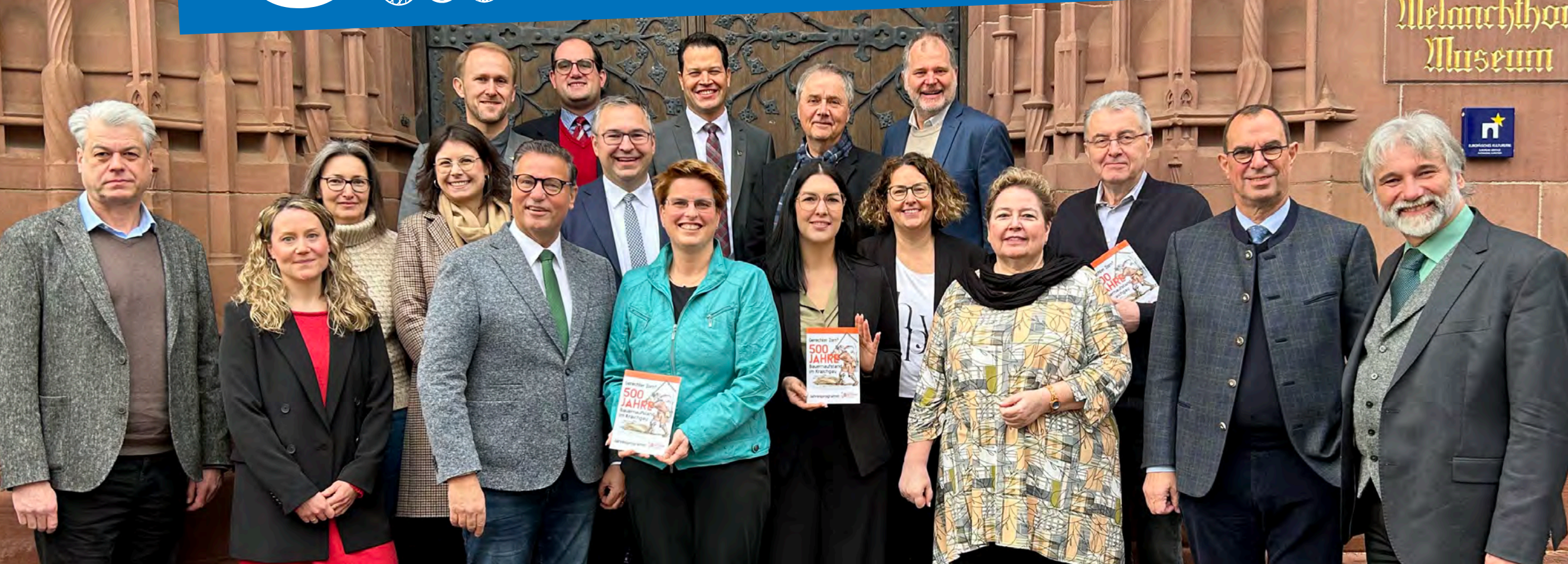
Landwirtschaftsminister Peter Hauck sowie die Bürgermeister aus dem Kraichgau waren zur Präsentation des Jahresprogramms ins Melanchthonhaus gekommen.