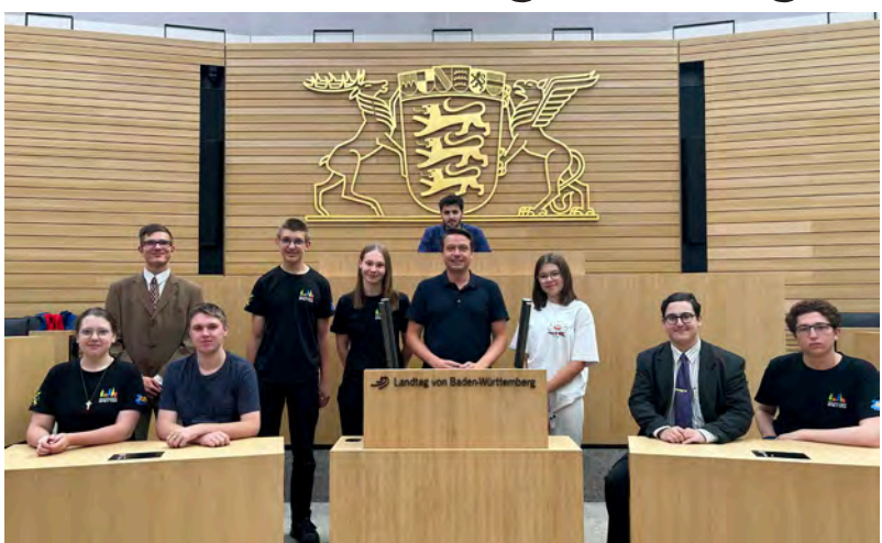
Brettener Jugendgemeinderat im Landtag in Stuttgart

Am vergangenen Samstag besuchte der Jugendgemeinderat der Stadt Bretten den Landtag in Stuttgart. Neben der Besichtigung des Landtags stand eine Diskussion mit einem Mitglied des Landtags auf dem Programm. Themen waren unter anderem die Funktionsweise des Landtags bzw. der Arbeitsalltag der Abgeordneten, die Bereiche Schule und Bildung, das Wahlrecht sowie die Themen Waffenrecht und innere Sicherheit, die Arbeitspolitik sowie die Sportförderung. Der Ausflug schloss mit einem gemeinsamen Mittagessen. (red)