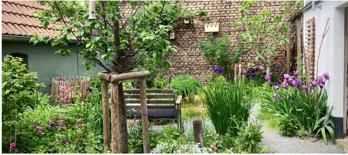
Beispiel für die naturnahe Gestaltung eines Gartens