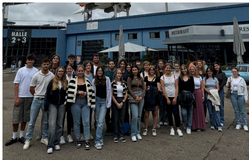
Bei einem Ausflug lernten sich die „Neuen“ und „Alten“ Azubis näher kennen.