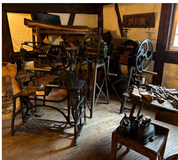
Museumsleiterin Linda Obhof gab interessierten Besucherinnen und Besuchern Einblicke in die Geschichte des Gerberhauses. Die Gäste hatten auch in Kleingruppen die seltene Gelegenheit, sich die Räumlichkeiten wie das Nähzimmer (Foto unten rechts) oder die „gute Stube“ anzuschauen.