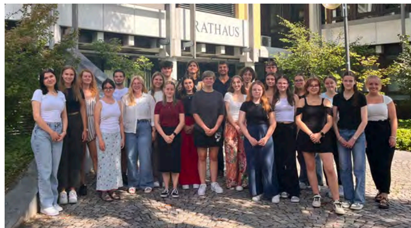
Die Stadt Bretten begrüßt alle Auszubildenden, Praktikanten und FSJler.