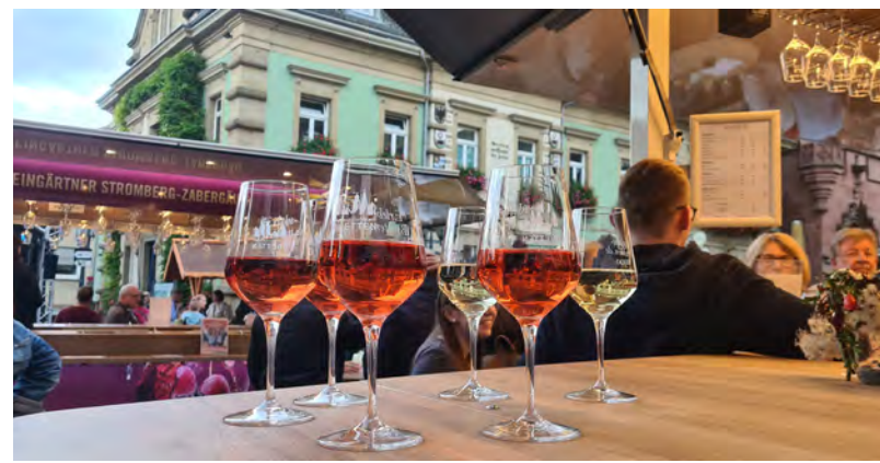
Weinprobe in entspannter Atmosphäre auf dem Brettener Marktplatz

Über das gesamte Weinmarkt-Wochenende veranstaltet das neue Aktions-Bündnis „BIG“ der Brettener Gewerbetreibenden eine Verlosung. Alles was Sie dafür tun müssen, ist etwas in den teilnehmenden Geschäften