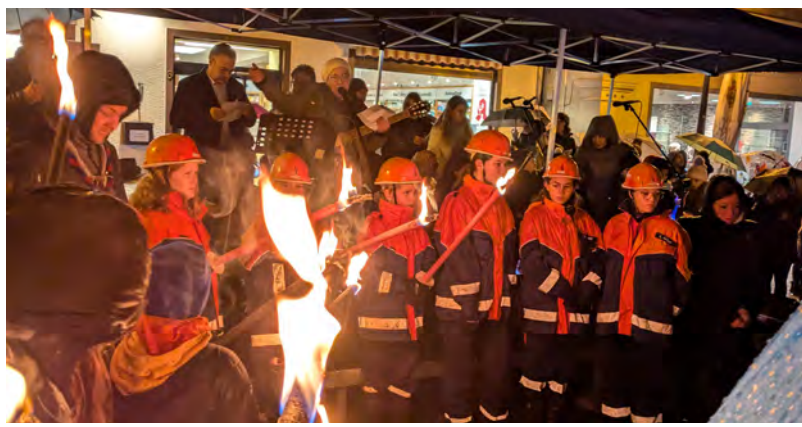
Zahlreiche Besucher umringen die Bühne und singen Martinslieder.