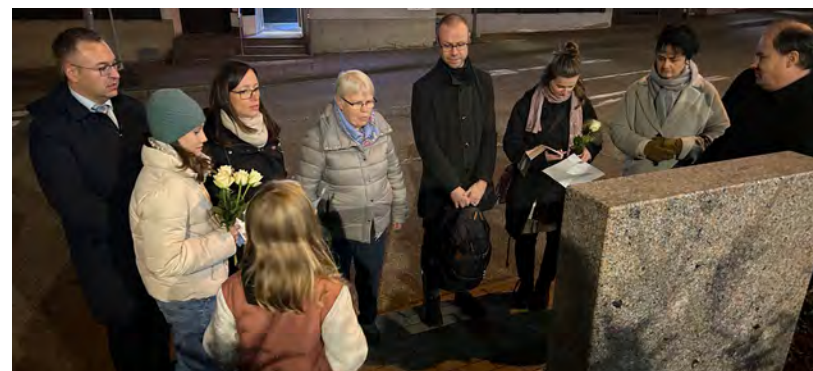
Gedenken am Ort der Brettener Synagoge