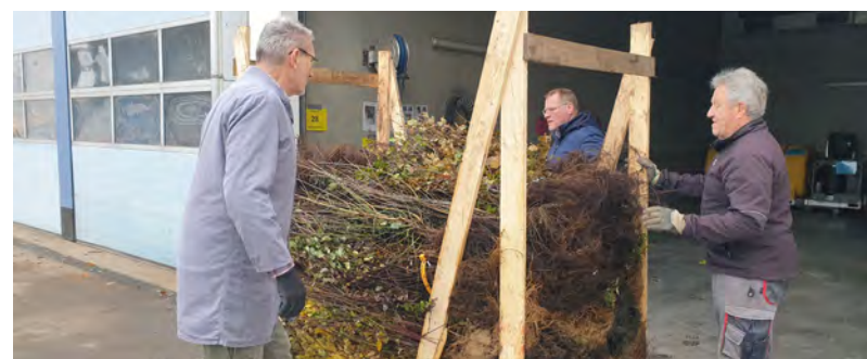
Anlieferung der bestellten Fruchtsträucher auf dem Baubetriebshof

Auch für 2025 ist die Fruchtsträucher-Aktion wieder geplant - wir freuen uns, wenn Sie dann wieder dabei sind. Ebenso beliebt war in diesem Jahr auch die parallel stattfindende Obstbaum-Aktion der Stadt Bretten, die mit rund 230 bestellten Obstbäumen einen erfolgreichen Abschluss fand. Mit Abstand am beliebtesten war 2024 der Apfelbaum (80 Bestellungen), gefolgt vom Birnen- (35 Bestellungen) und Kirschbaum (29 Bestellungen). „Die Obstbaumaktion ist reibungslos verlaufen und die Aktion wurde sehr gut angenommen“, zeigt sich Baubetriebshof-Leiter Stefan Lipps sehr zufrieden. Bei der Ausgabe der Obstbäume unterstützt wurden die sechs Mitarbeiterinnen und Mitarbeiter des Baubetriebshofs am Samstag vom Obst- und Gartenbauverein Bretten, der Interessierten einen kostenlosen Wurzelschnitt bot. (red)