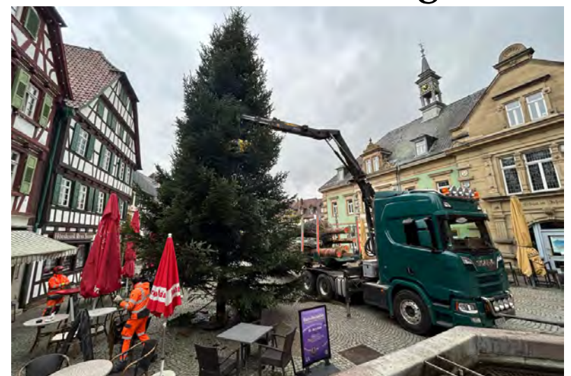
Seit Montag schmückt eine Tanne den Marktplatz.