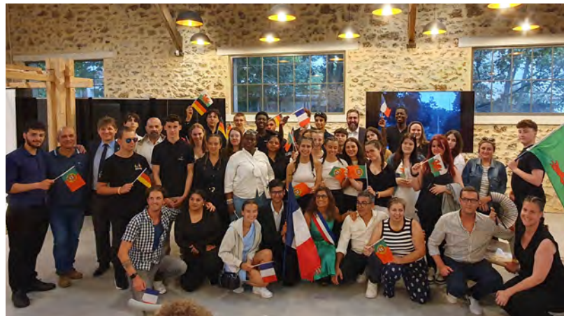
Internationaler Austausch beim Kleeblatt-Jugendtreffen in Longjumeau

In der vergangenen Woche hatten Jugendliche aus Bretten die Gelegenheit, eine Reise in die französische Partnerstadt Longjumeau zu unternehmen. Die Brettener Gruppe, bestehend aus einem Auszubildenden der Stadt Bretten, Vertretern des Jugendgemeinderats sowie Jugendlichen aus der Melanchthonstadt, verbrachte die Zeit mit weiteren Jugendlichen aus den Partnerstädten Pontypool (Wales), Condeixa-a-Nova (Portugal) und Longjumeau (Frankreich). Auf dem Programm standen u. a. Workshops zu den Themen Klima und Umwelt sowie Ausflüge zu Sehenswürdigkeiten und nach Paris. Die internationale Jugendreise, die seit vielen Jahren fester Bestandteil des Austauschs zwischen den Kleeblatt-Städten ist, bot den Teilnehmern wieder die Möglichkeit, neue Freundschaften zu knüpfen,