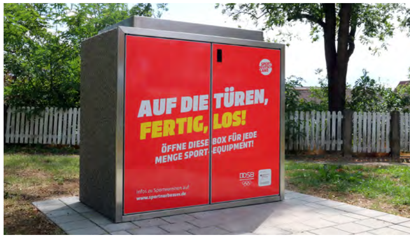
Die Sportbox im Stadtpark kann kostenlos genutzt werden.

Seit Juni bietet der TV Bretten in Kooperation mit der Stadt Bretten unter dem Motto „Fit durch den Sommer“ ein Bewegungsangebot im Freien an. Bei der Sportbox im Stadtpark können Interessierte jeden Alters donnerstagvormittags mit Trainerin Lisa Wiech verschiedene Geräte aus der Sportbox ausprobieren und etwas für die eigene Gesundheit tun. Das Sportangebot „Fit durch den Sommer“ geht nun in eine kleine Sommerpause: Urlaubsbedingt findet am 29. August kein angeleitetes Sportprogramm statt. Anfang September soll die beliebte Veranstaltungsreihe aber weiter fortgesetzt werden.