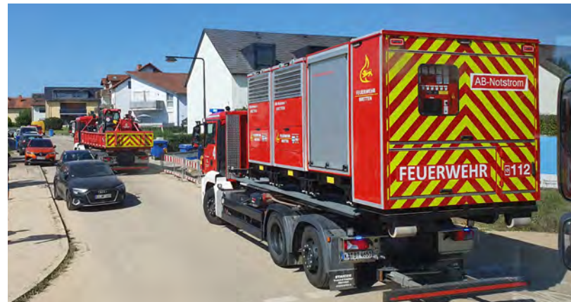
Die Feuerwehr Bretten rückte neben Gondelsheim auch nach Helmsheim aus (siehe Bild) und unterstützte die Bevölkerung nach den Hochwasserschäden.

Bischoff, Bereichsleiter Allgemeinbetrieb des Bretteners Baubetriebshofs, sichtlich zufrieden mit der Aktion. Auch die Feuerwehr half am Mittwoch, 14. August, der Gemeinde Gondelsheim und der Feuerwehr Gondelsheim aus. Von der Abteilung Bretten wurde ein Löschfahrzeug